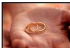
L'alliance, symbole du mariage et du Pacs - Julien Zerbib

"La rencontre du mariage et du Pacs" est le plus grand salon organisé dans l'Est de la France. Vous y trouverez tout pour immortaliser votre événement.